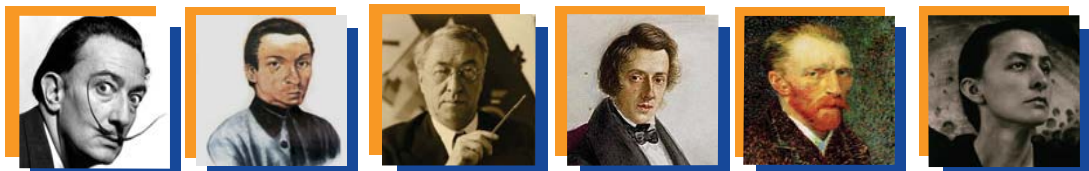
Salvador Dali | António Francisco Lisboa "Aleijadino" | Wassily Kandinsky | Frédéric Chopin | Vincent Van Gogh | Georgia O'Keeffe